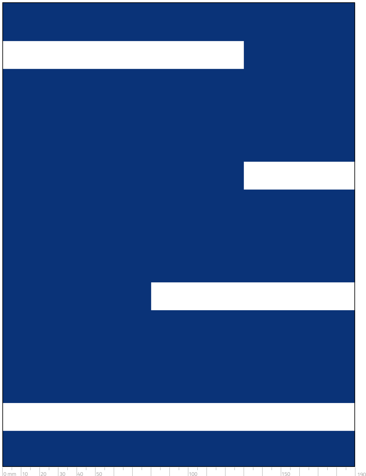
Vzorka plechu RECTANGLE - výrez na formáte A4 v mierke 1:1