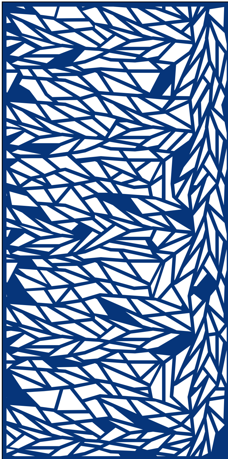
Vzorka plechu 1000 x 2000 mm v mierke 1:10

Sídlo spoločnosti Perfora spol. s r. o. Trstínska cesta 19 917 01 Trnava