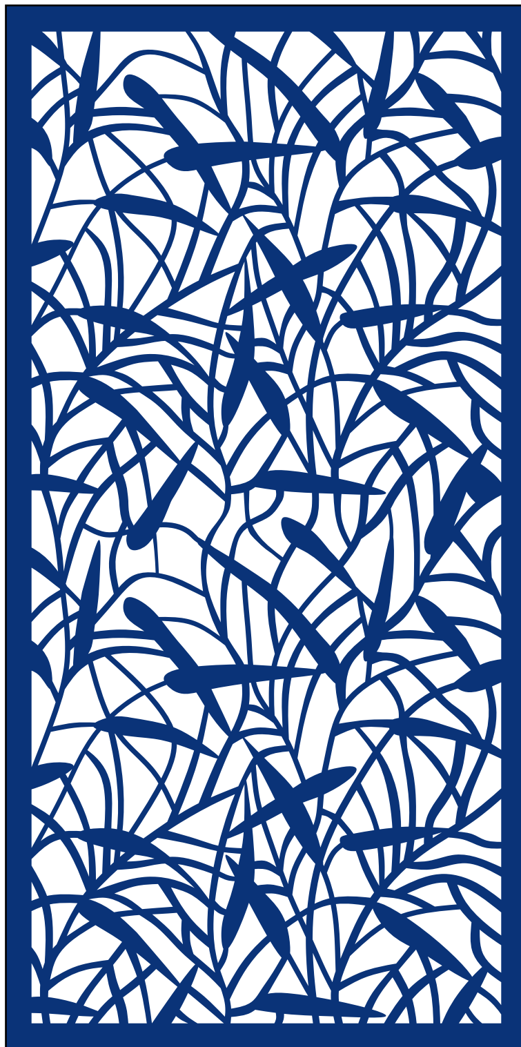
Vzorka plechu 1000 x 2000 mm v mierke 1:10

Sídlo spoločnosti Perfora spol. s r. o. Trstínska cesta 19 917 01 Trnava